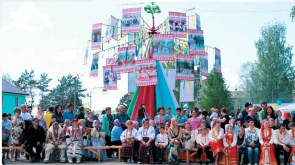
▲ Фестиваль «Древо жизни» в Винницах