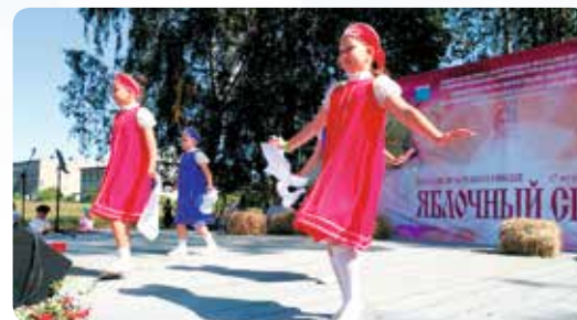
▲ «Яблочный спас» в Вистино

II. Организационная поддержка национально-культурных некоммерческих организаций коренных малочисленных народов, прожива-