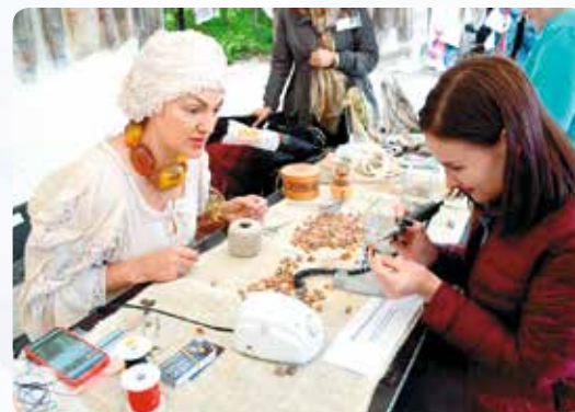
▲ Фестиваль «Россия – созвучие культур» во Всеволожске