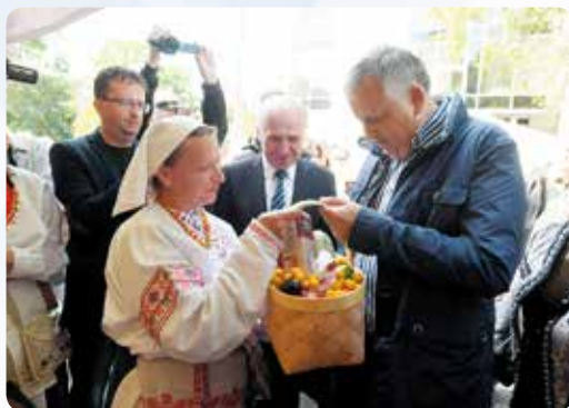
◀ Губернатор Ленинградской области на этнокультурном фестивале «Россия – созвучие культур» во Всеволожске

«Гармонизация межнациональных и межконфессиональных отношений в Ленинградской области» и «Поддержка этнокультурной самобытности коренных малочисленных народов, проживающих на территории Ленинградской области».