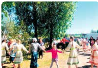
▲ Фестиваль «Троицкая ярмарка» в д. Старая Слобода, Лодейнопольский район