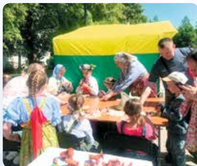
◀ Фестиваль коренных народов в рамках Дня коренных народов прошел в г. Кириши

Результаты ежегодного мониторинга межнациональных и межконфессиональных отношений позволяют сделать выводы об эффективности проводимой работы – более 70 % населения оценивают межкультурное и межконфессиональное взаимодействие положительно.