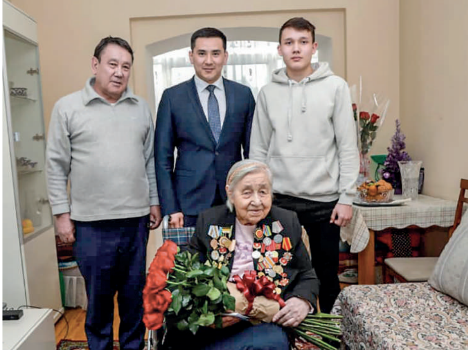
▲ Фотография из семейного архива