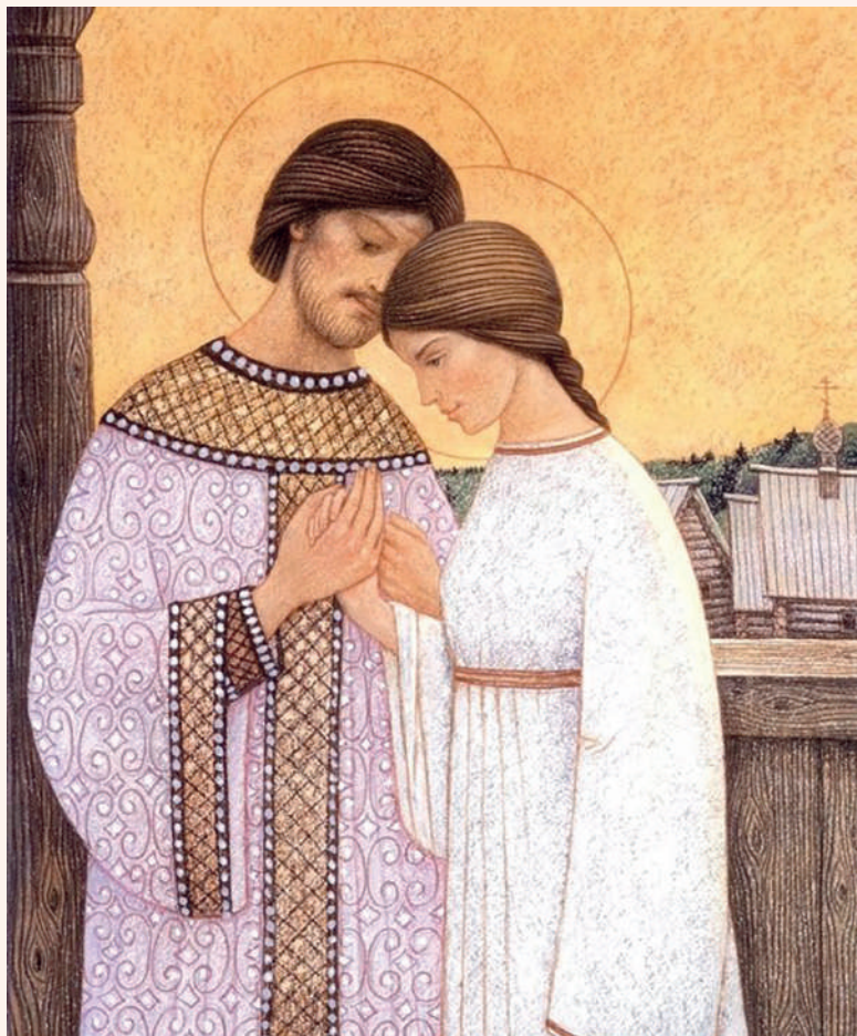
🔺 Святые Петр и Феврония

Примерно в первой половине XIII века в Муроме правил князь Павел, брата его звали Петром. И вот к жене князя Павла начал являться змей, соблазняя ее. Не в силах это терпеть, княгиня рассказала все мужу. Князь Павел попросил жену выпытать у змея, от чего он погибнет. Ответ был таков: «Смерть моя от Петрова плеча, от Агрикова меча».