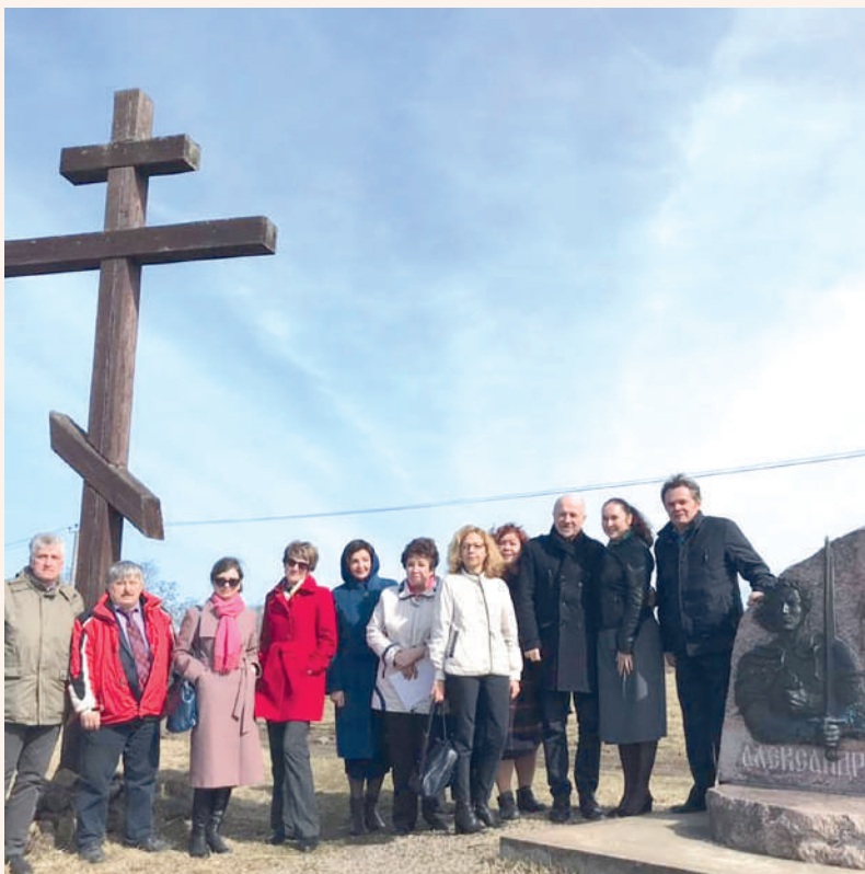
↑ Участники круглого стола «Вклад Александра Невского в сохранение восточно-славянских племен» в д. Пустынка на месте стоянки дружины князя Александра перед Невским сражением

не — послы от папы из Европы» <к Александру Невскому, чтобы выставить свои условия. В ответ Александр Невский напомнил им, что> «закон земли Русской знаю и их учение не приемлю». Как показывает история, этот ответ не вразумил посланников римского папы. Нетрудно догадаться, какой смысл вкладывал Александр Невский в эту фразу, когда разгромил шведов и рыцарей в 1240 и 1242 годах в крупнейших сражениях на берегу Невы и Чудского озера.