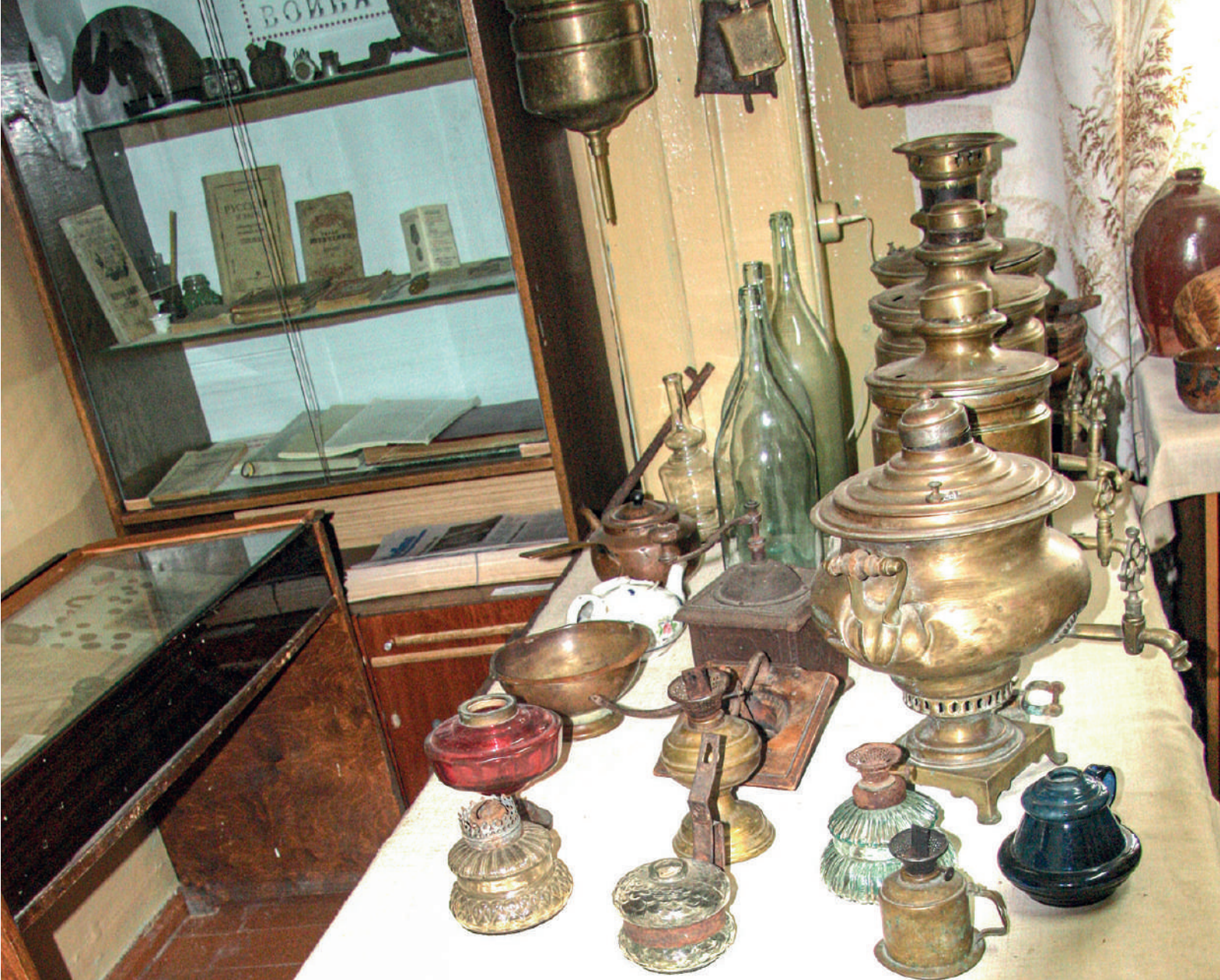
🔺 Выставка предметов быта