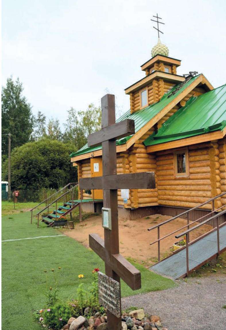
⤴ Храм Петра и Февронии в Тосно

Достигнув преклонных лет, по благочестивому обычаю Петр и Феврония приняли монашество с именами Давид и Ефросиния. Будучи разделены монастырскими стенами, они просили у Бога единовременной кончины.