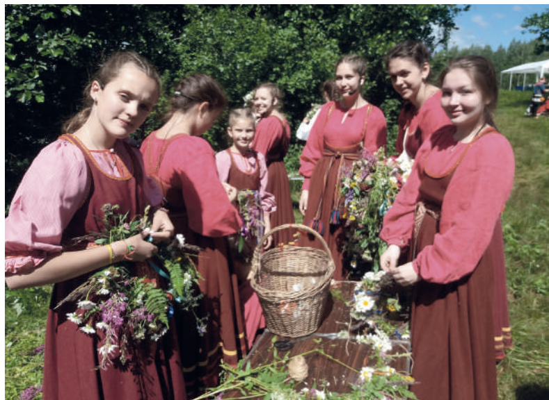
➤ Празднование Иванова дня

Самые смелые и отважные мужчины пытались в ночь на Ивана Купалу найти цветок папоротника. По легенде, тот, кто сорвет цветок папоротника до первых петухов, сможет видеть находящиеся под землей клады и станет понимать язык животных. Наверное, мудрый народ понимал, что вероятность этого равна возможности найти цветок растения, которое, как известно, никогда не цветет.