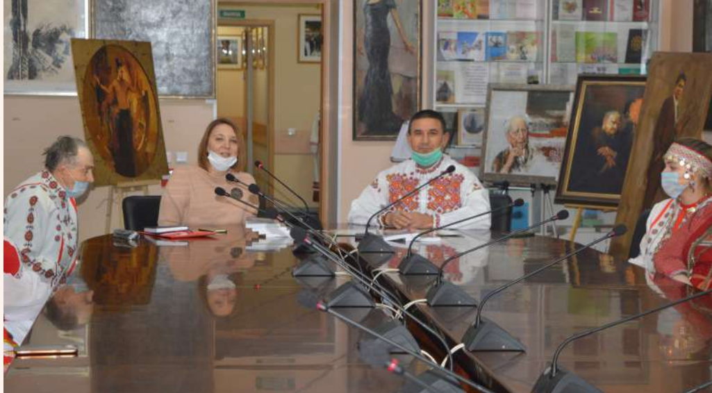
«Чувашский язык и грамматика», в рамках «Недели родного языка»

Для Ленинградской области вопросы языковой политики, развития русского языка, сохранения языков народов России, в том числе коренных малочисленных, имеют чрезвычайно важное значение, так как связаны с гармонизацией межканальных и межрелигиозных отношений. Сохранение уникального культурного наследия невозможно без бережного отношения к языковому многообразию.