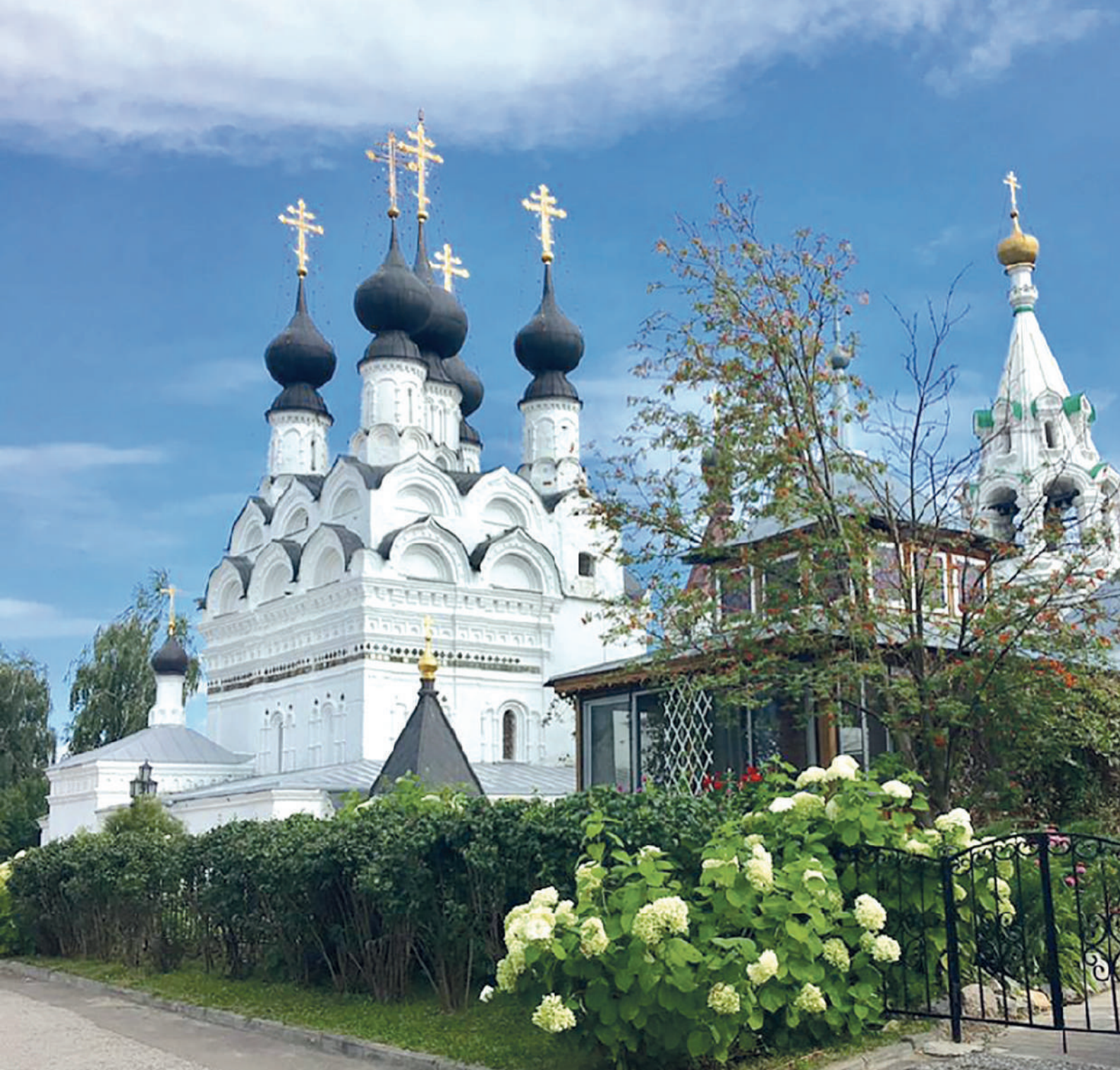
🔺 Свято-Троицкий женский монастырь в Мурмане

проходят праздничные мероприятия, посвященные Дню любви, семьи и верности. В местном ЗАГСе представители администрации муниципального образования поздравляют семейные пары, отметившие «бриллиантовые», «золотые», «рубиновые»