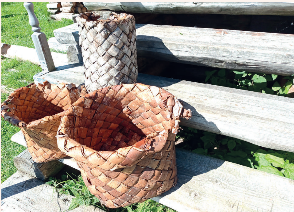
🔺 Плетеные изделия из бересты

ленький музей в поселке лесорубов Курба.