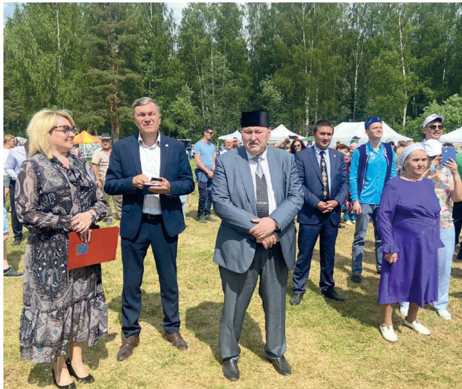
На Сабантуй в Тосно всегда приезжает много гостей

Для желающих ближе познакомиться с традиционной татарской и башкирской культурами организуются мастер-классы по изготовлению традиционных татарских кукол, национальной атрибутики и декоративно-прикладному творчеству «Это вы можете!».