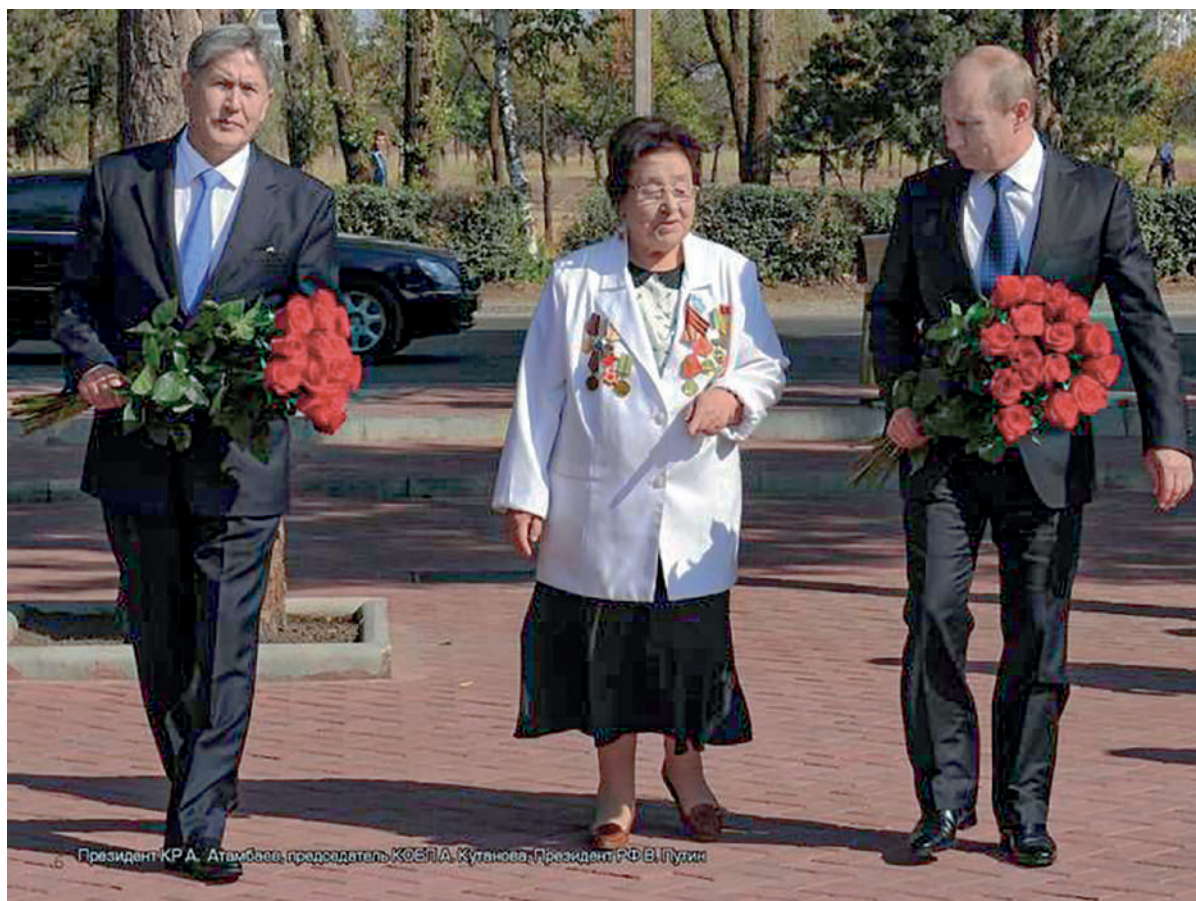
Президент КРА Атамбаев, председатель КСЭПА Кутанова, Президент РФ В. Путин