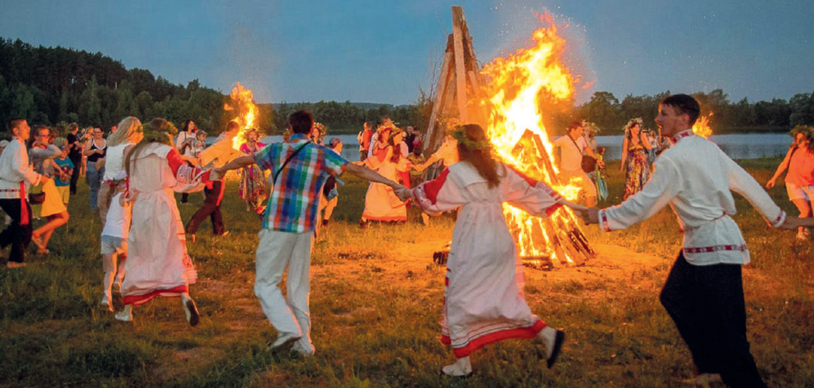
🔥 Традиционный хоровод вокруг купальского костра